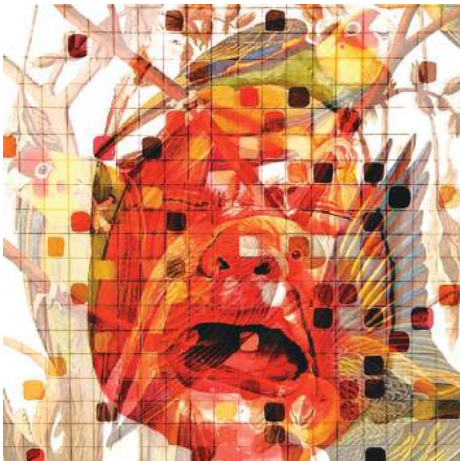
GERMINANT_03 (Tècnica mixta.30 x 30 cm.) 2023.