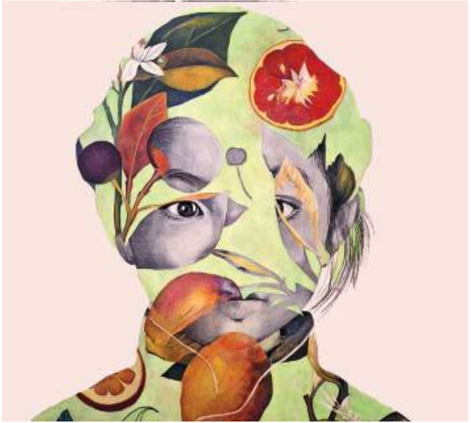
WABI-SABI (Acrílic i llapis de color sobre taula. 90 x 90 cm.) 2023.