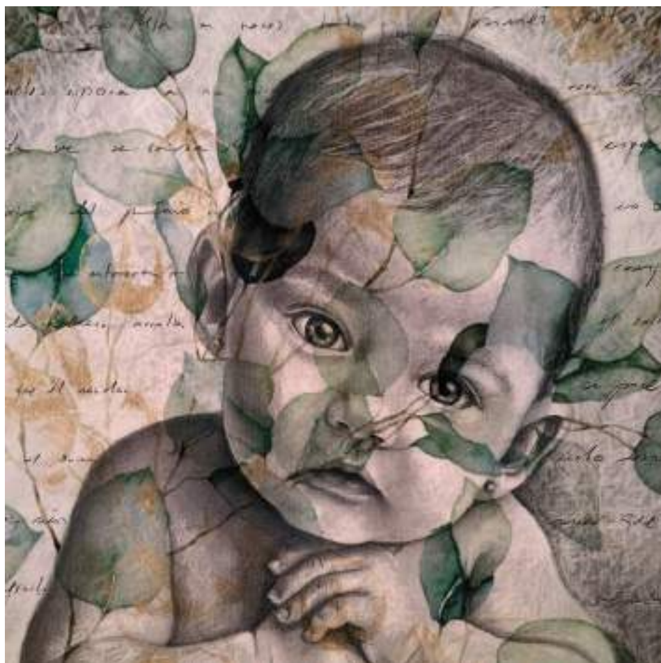
GERMINANT (Tècnica mixta.30 x 30 cm.) 2023.