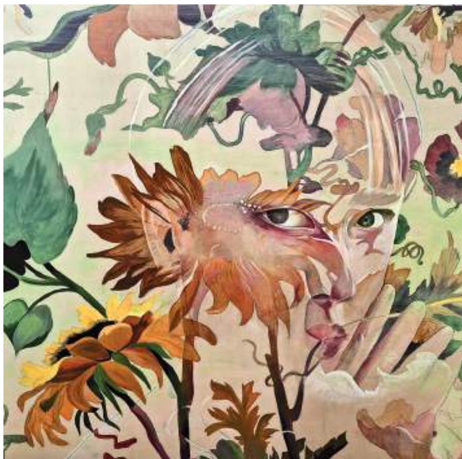
LADY BOY (Acrílic i llapis de color sobre taula. 120 x 120 cm.) 2023.