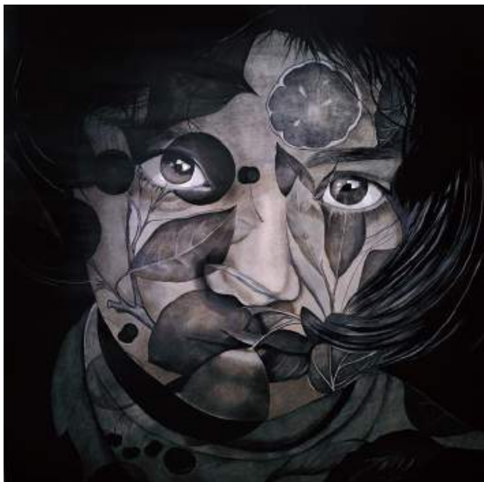
ABSCONDITA_03 (Acrílic i llapis de color sobre taula. 120 x 120 cm.) 2023.