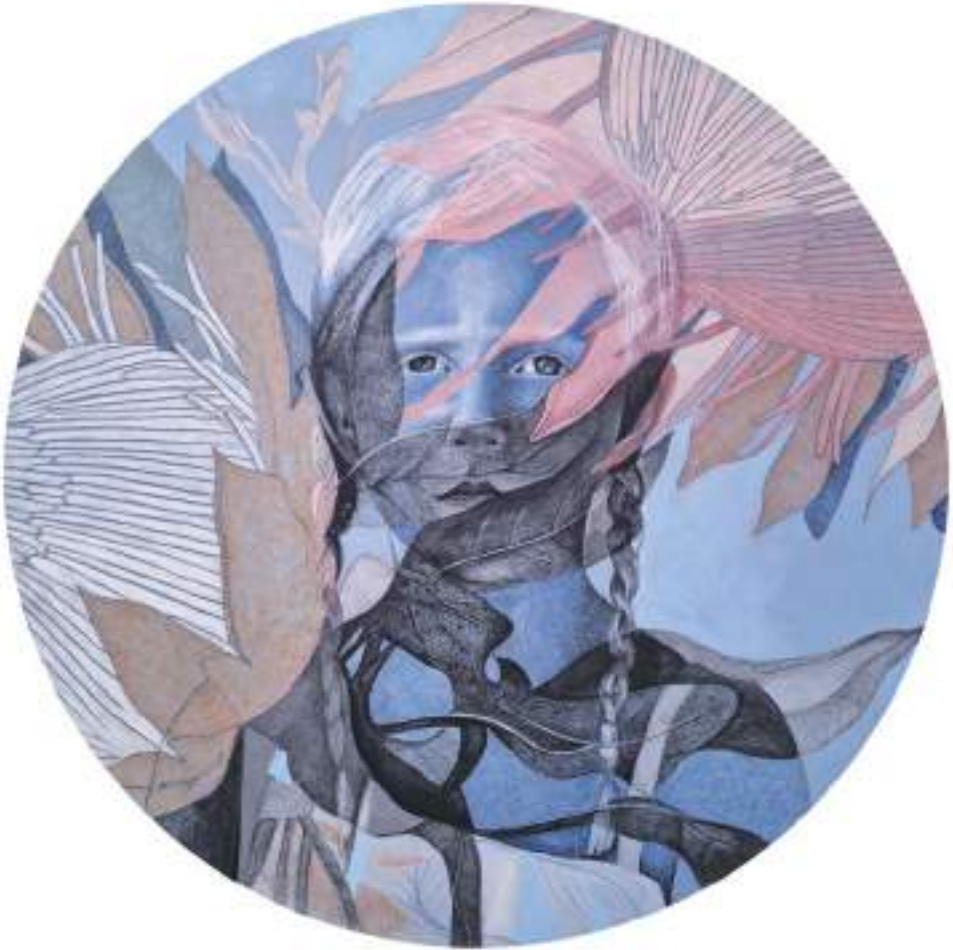
HIDDEN MATILDA (Acrílic i llapis de color sobre taula. 60 cm de diàmetre.) 2023.