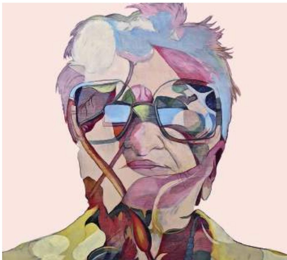
WABI-SABI_02 (Acrílic i llapis de color sobre taula. 90 x 90 cm.) 2023.