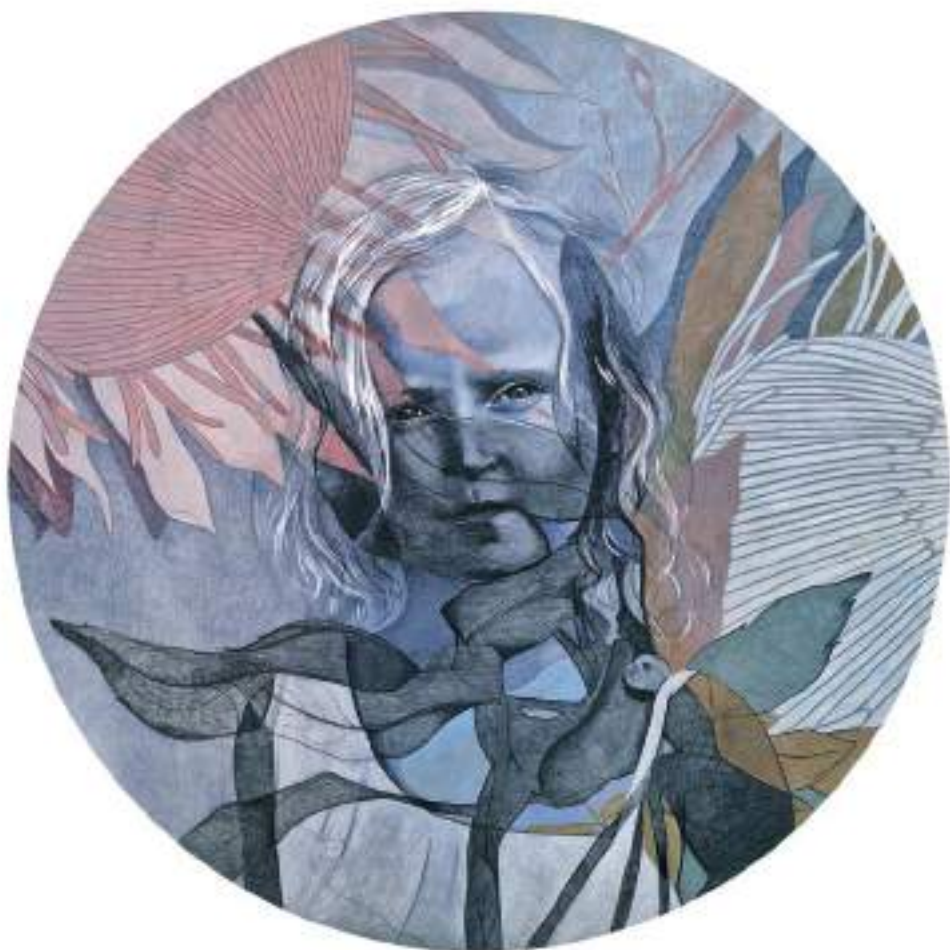
HIDDEN MABEL (Acrílic i llapis de color sobre taula. 60 cm de diàmetre.) 2023.