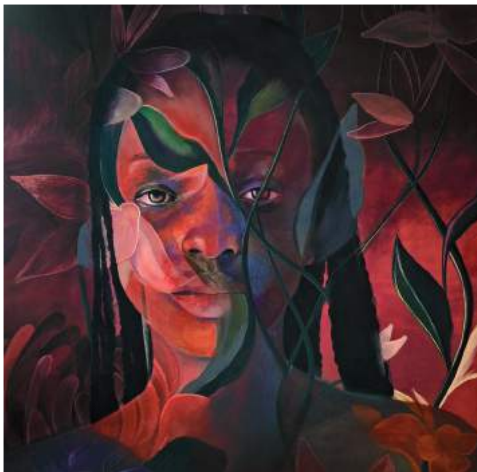
ABSCONDITA_05 (Acrílic i llapis de color sobre taula. 120 x 120 cm.) 2023.