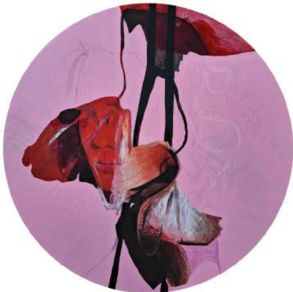
DONA EN ROSAT (Acrílic i llapis de color sobre taula. 60 cm de diàmetre.) 2023.