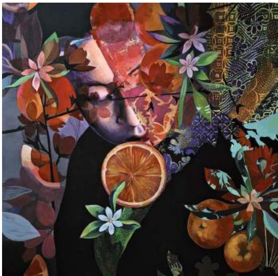
ABSCONDITA_04 (Acrilic i llapis de color sobre taula. 120 x 120 cm.) 2023.