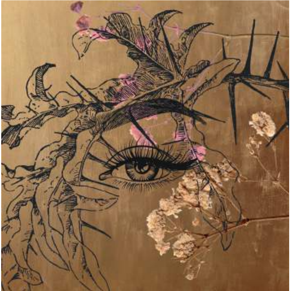
RENAIXENÇA_02 (Acrílic sobre llenc.100 x 100 cm.) 2023.