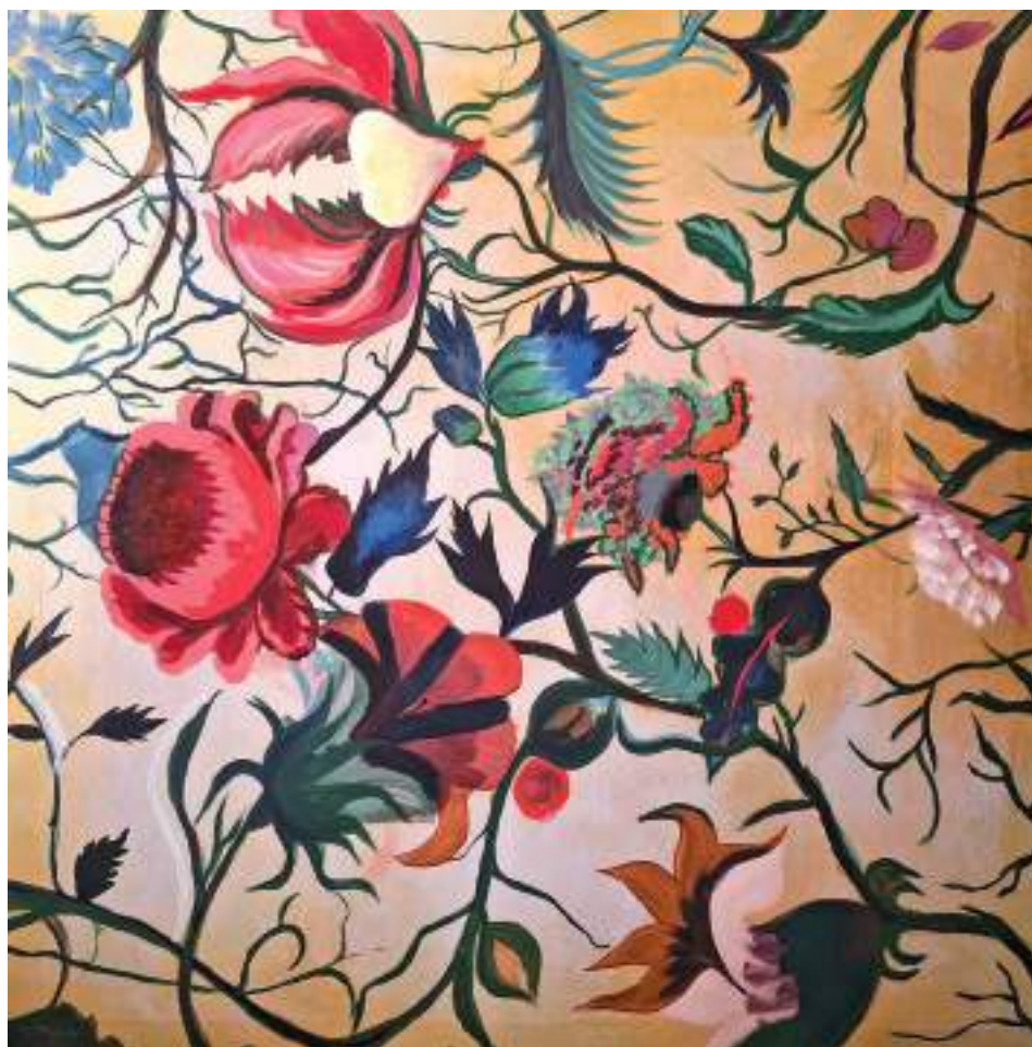
RENAIXENÇA_01 (Acrílic sobre llenc. 100 x 100 cm.) 2023.