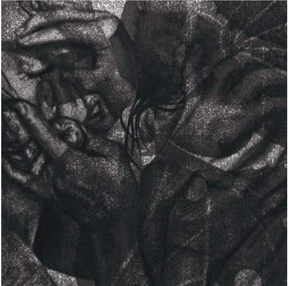
FIGURES PER TOT ARREU (Tècnica mixta.30 x 30 cm.) 2023.