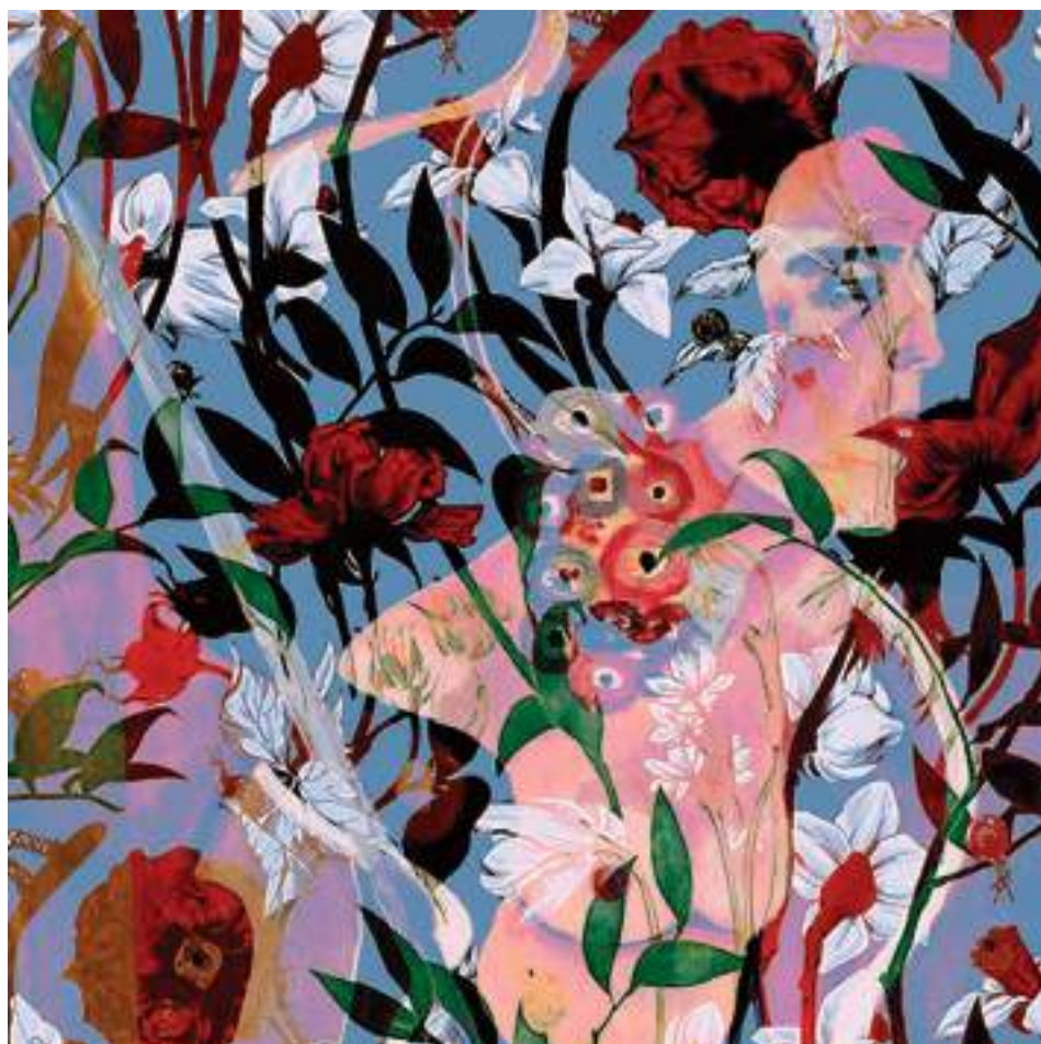
HOMENATGE (Tècnica mixta.30 x 30 cm.) 2023.