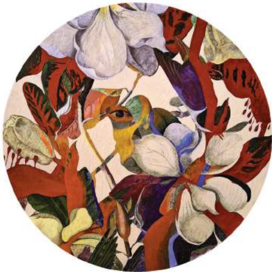
A MÈXIC TAMBÉ PASSA (Acrílic i llapis de color sobre taula. 60 cm de diàmetre.) 2023.