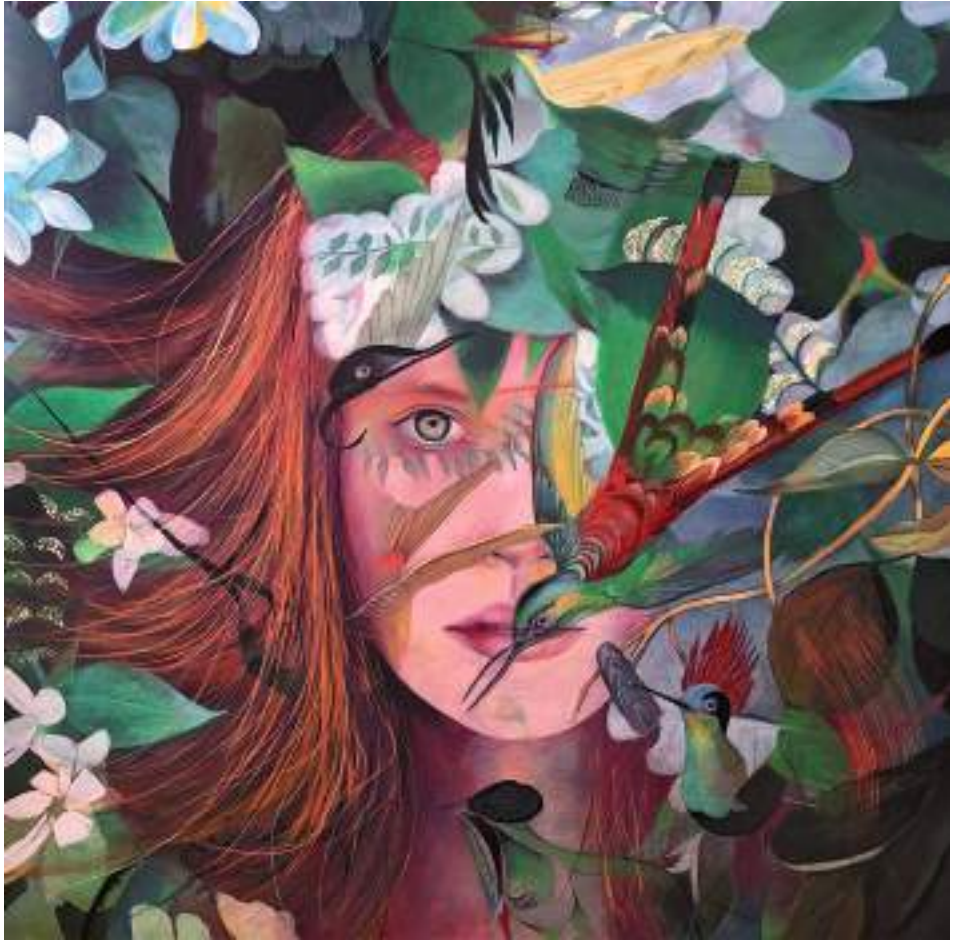
ABSCONDITA_02 (Acrílic i llapis de color sobre taula. 120 x 120 cm.) 2023.