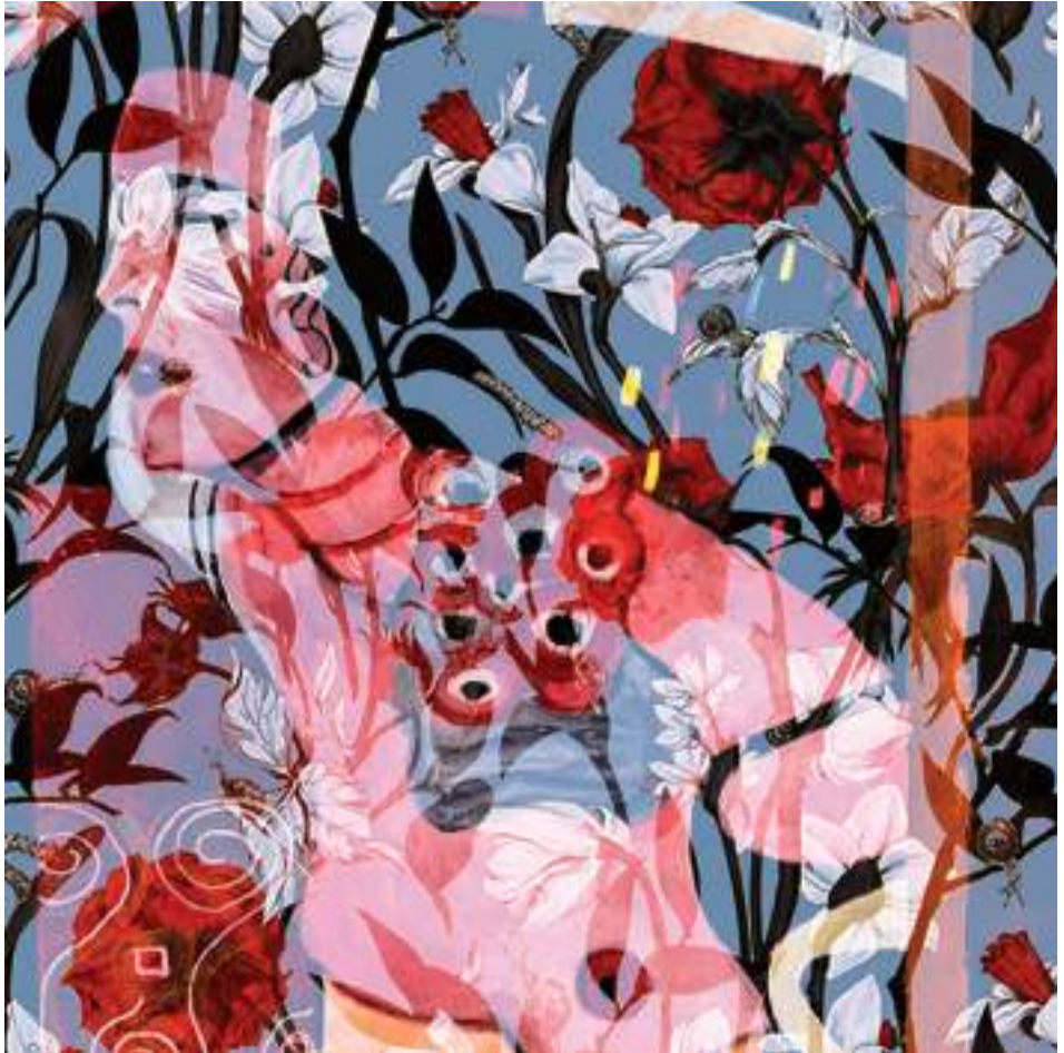
HOMENATGE_02 (Tècnica mixta.30 x 30 cm.) 2023.