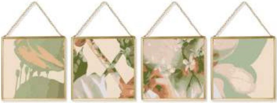
ABSCONDITA_07 (Impressió sobre paper. 20 x 25 cm. 4 peces.) 2023.