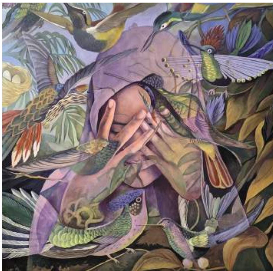
ABSCONDITA_01 (Acrílic i llapis de color sobre taula. 120 x 120 cm.) 2023.