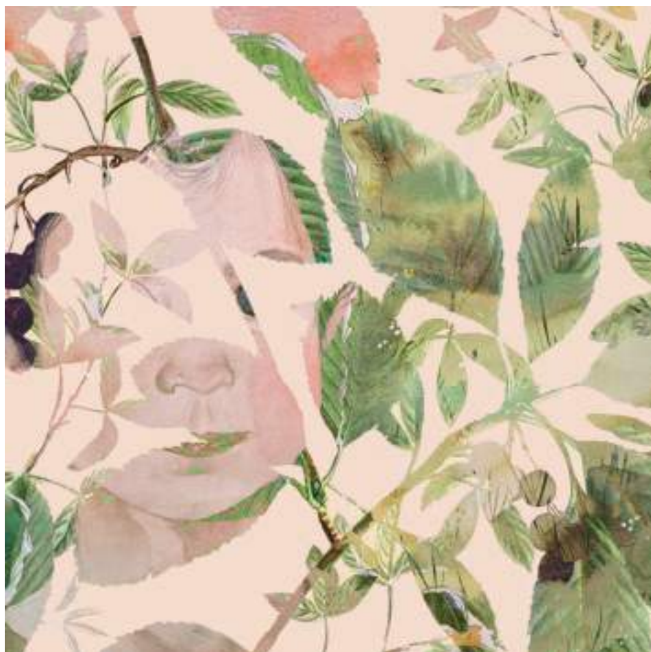
GERMINANT_02 (Tècnica mixta.30 x 30 cm.) 2023.