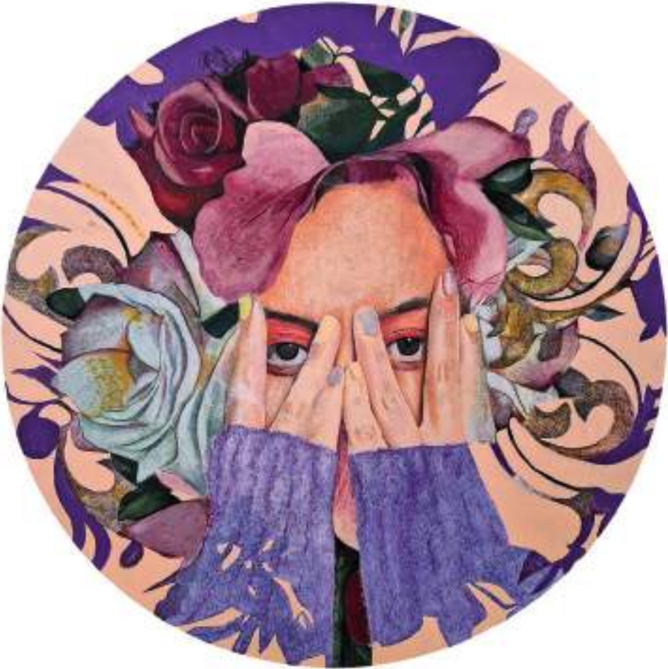
DONA EN MORAT (Acrílic i llapis de color sobre taula. 60 cm de diàmetre.) 2023.